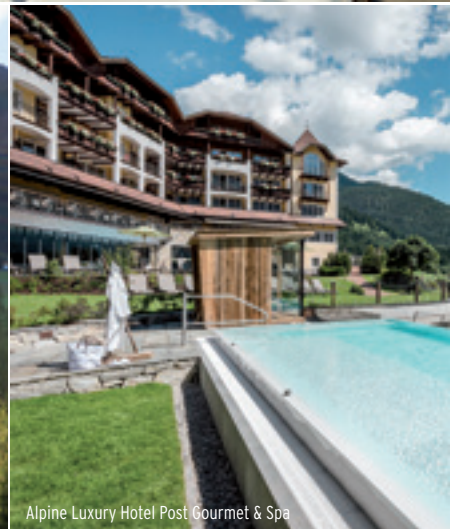
Alpine Luxury Hotel Post Gourmet & Spa