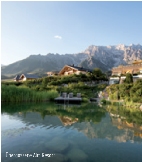
Übergossene Alm Resort