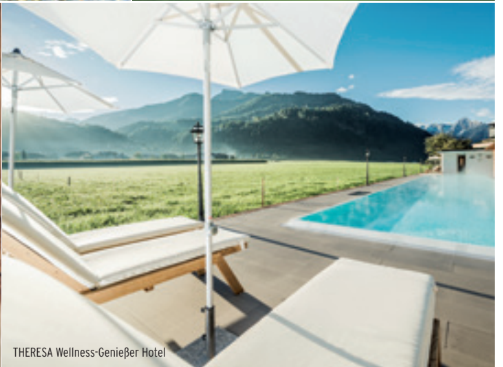
THERESA Wellness-Genießer Hotel