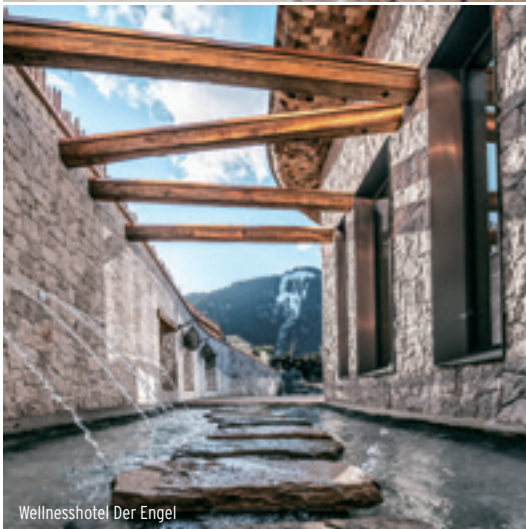
Wellnesshotel Der Engel