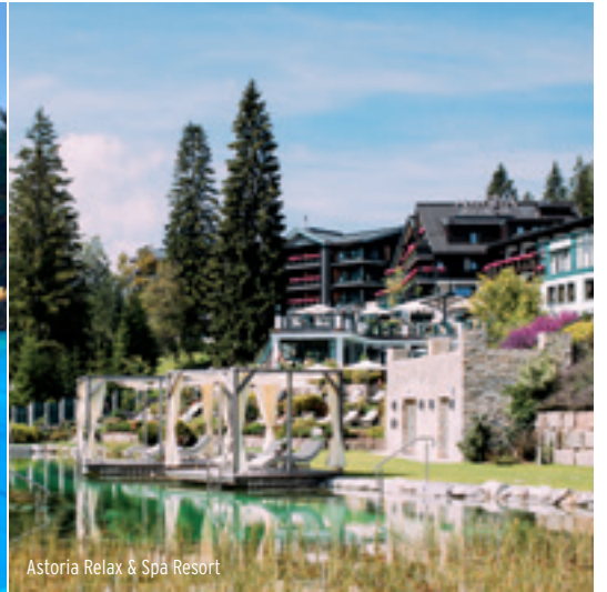
Astoria Relax & Spa Resort