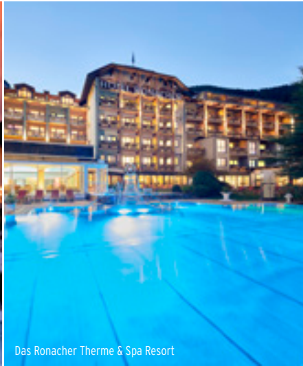
Das Ronacher Therme & Spa Resort