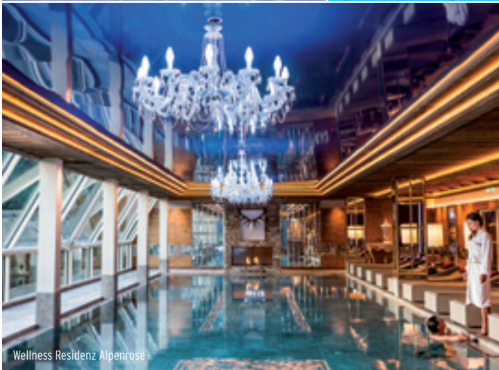
Wellness Residenz Alpenrose