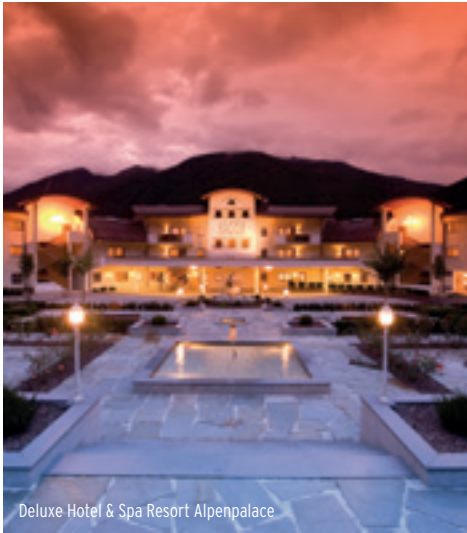
Deluxe Hotel & Spa Resort Alpenpalace